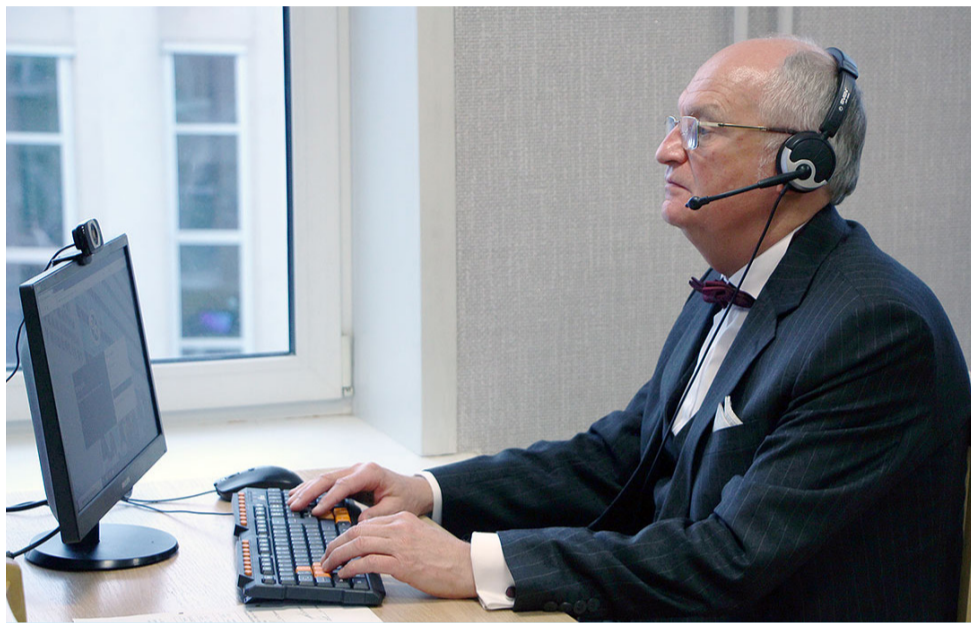
На снимке: декан ВШУБ проводит online-конференцию с новым контингентом обучающихся по новым образовательным программам ДФПО БГЭУ.