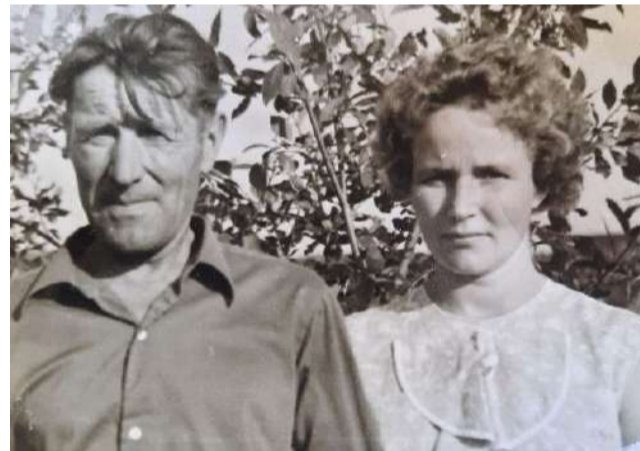
Прадед со своей старшей дочерью

Но даже после такого ужасного опыта, прадед еще участвовал в военных действиях под Гродно, где был ранен. И уже после войны, когда рассказывал близким об этих ужасных событиях, сквозь слезы добавлял: «Чтоб только вы, дети, никогда с подобным не сталкивались».