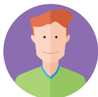
Будущий владелец бизнеса