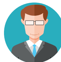
Профессиональный управленец, стремящийся к карьерному росту

ПОСТУПАЯ В МАГИСТРАТУРУ «УПРАВЛЕНИЕ РАЗВИТИЕМ БИЗНЕСА» ВЫ ПОЛУЧАЕТЕ: