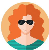
Частный предприниматель, собственник или руководитель компании