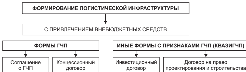
Рис. 2. Предлагаемая схема форм и механизмов формирования логистической инфраструктуры с привлечением внебюджетных средств